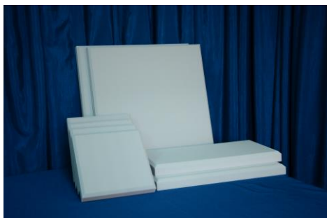
Стандартные панели ЭхоКор