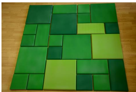
Окрашенные панели ЭхоКор