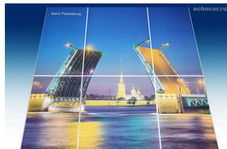
Фотопечать на панелях ЭхоКор